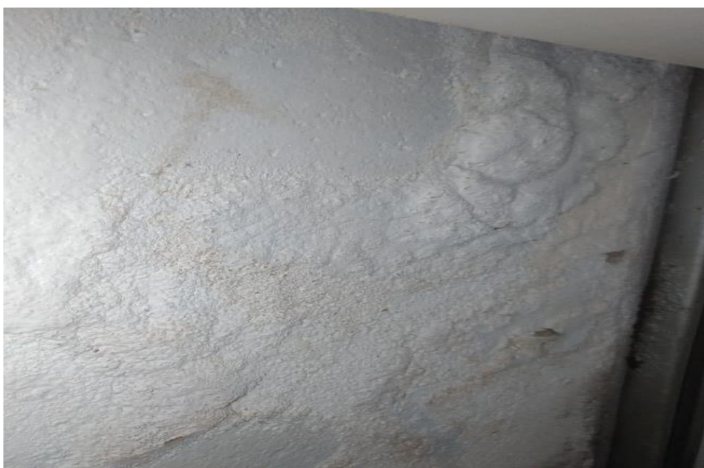
Figura 4 - Demonstração de Vesículas no Revestimento.

A figura acima, apresenta bolor, mofo e eflorescência próximo ao rodapé da parede lateral, causada pelo alto teor de umidade no reboco provocando os surgimentos dessas patologias.