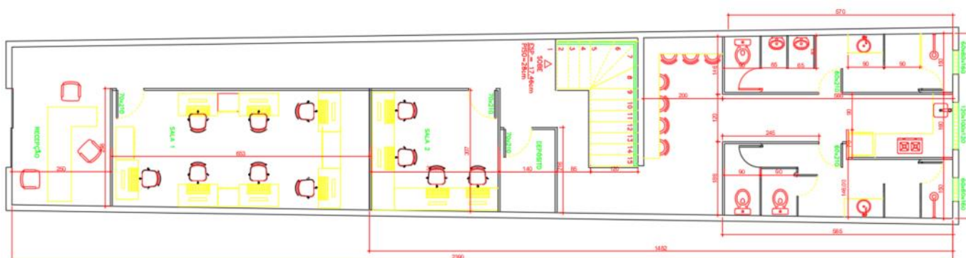
Figura 1 - Planta Baixa do Pavimento Térreo

A sala comercial, objeto deste estudo, passou por uma reforma no ano de 2015, onde foi projetado e executado um subsolo para atender às necessidades dos proprietários de obter mais espaço para depósito das mercadorias e escritório. Com a reforma a loja passou a ter uma área de 104m 2 no pavimento térreo e 66m 2 no subsolo. A figura 01 e 02 detalha o projeto.