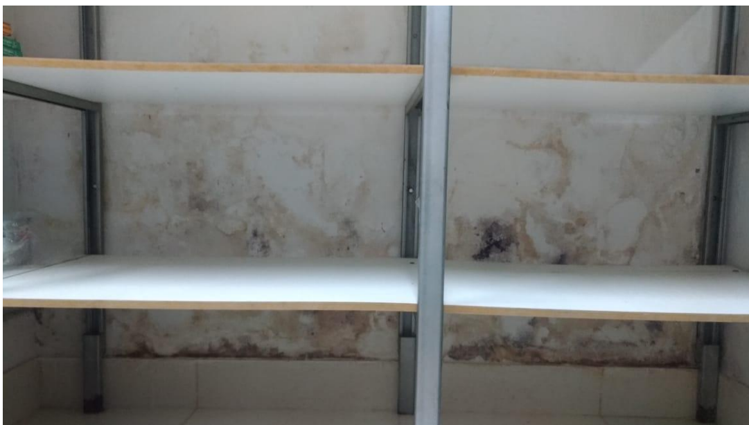
Figura 5 - Demonstração de Bolor e Mofo no Revestimento.