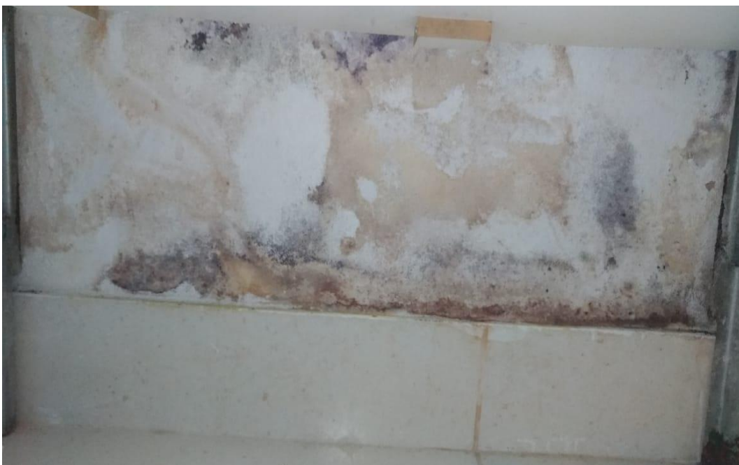
Figura 3 - Demonstração de Eflorescência, Bolor e Mofo no Revestimento.