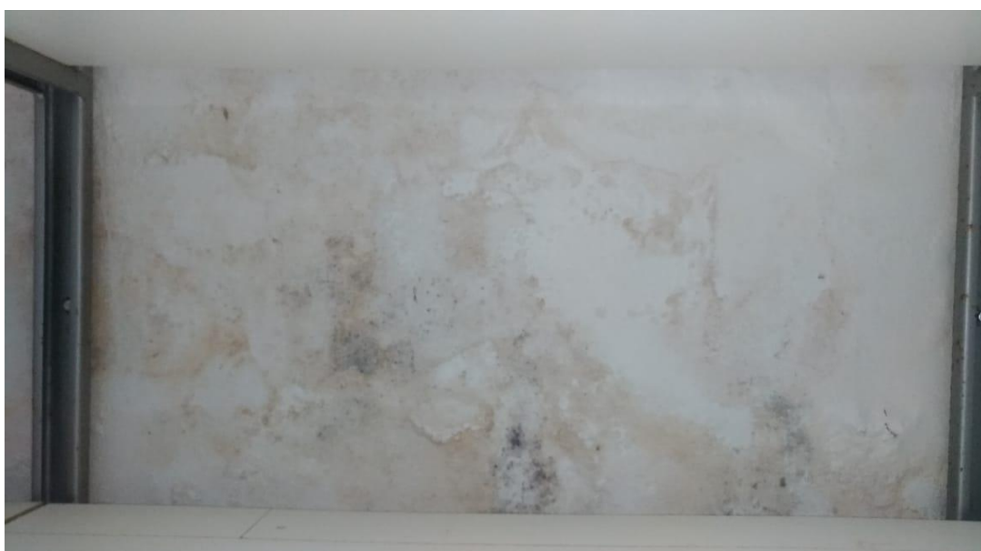
Figura 6 - Demonstração de Bolor, Mofo e Vesículas no Revestimento.