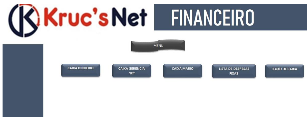
Imagem 10 – Planilha Lançamentos Caixa