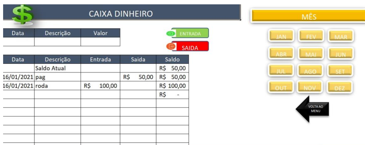
Imagem 11- Planilha Caixa Dinheiro