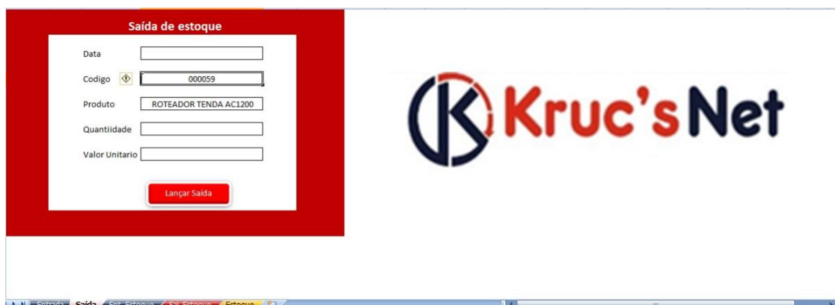
Imagem 16 - Saídas de Produtos