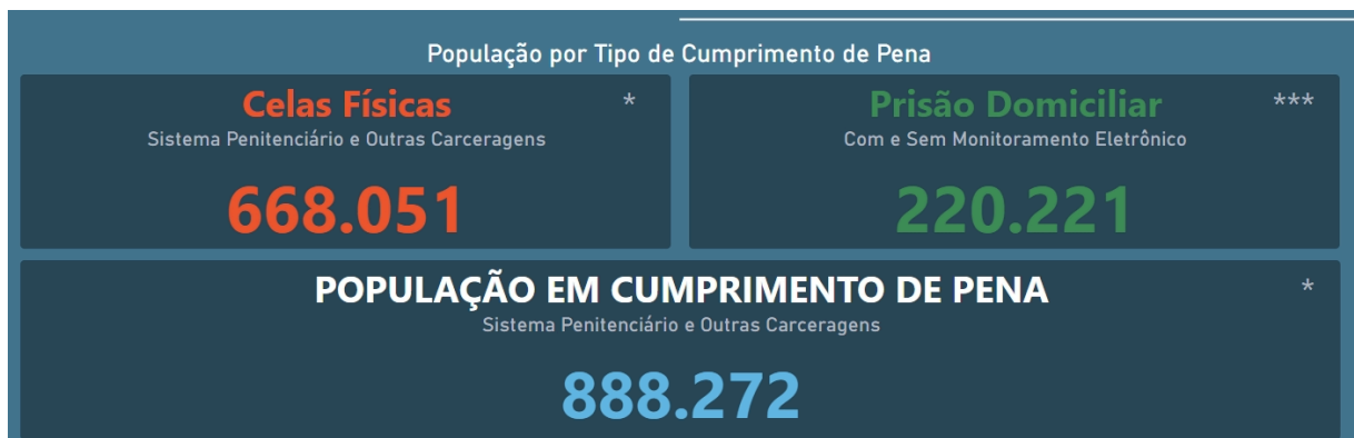
Gráfico disponibilizado pelo SISDEPEN em Microsoft Power BI , acessado em 08 de novembro de 2024.

Contabilizando apenas os presos em celas físicas (excluídos aqueles em prisão domiciliar), a população carcerária é de aproximadamente 668.051 (seiscentos e sessenta mil e cinquenta e um) presos, somados a 156.066 (duzentos e vinte mil e duzentos e vinte um) presos em prisão domiciliar.