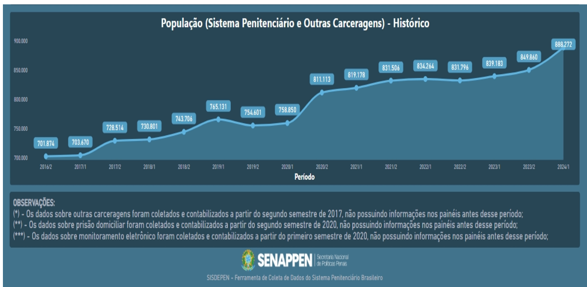
Gráfico disponibilizado pelo SISDEPEN em Microsoft Power BI , acessado em 08 de novembro de 2024.

O gráfico acima evidencia que a população prisional brasileira cresceu demasiadamente ao longo dos anos. Durante o período de pandemia houve uma pequena diminuição da população carcerária possivelmente ocasionado pela pandemia da Covid-19, no entanto, houve um grande aumento após o referido período.