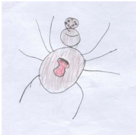
Figura 2 – Desenho depois da explicação

As ilustrações devem ser inseridas no texto centralizadas e o mais próximo possível de onde são citadas. O título da ilustração deve ser composto pela palavra que designa o tipo de ilustração (ex. Figura, Gráfico, Fluxograma ou outro tipo), seguido de numeração arábica progressiva. Título e fonte devem acompanhar as margens da ilustração, conforme o exemplo da Figura 2.